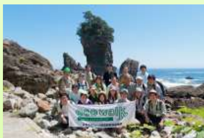
写真：8月のテストウォーク